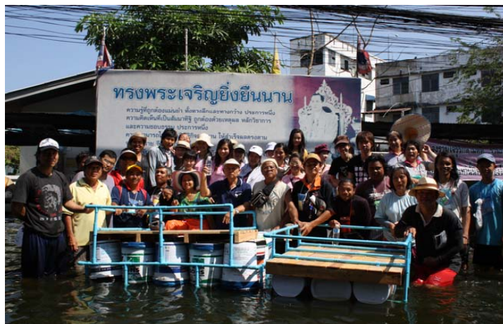
ด้านยาเสพติด ของบสนับสนุนจากสำนักงานส่งเสริมคุณภาพ (สสส.) และกองปราบปรามยาเสพติด สำนักงานตำรวจ

ต่างๆ เช่น ค่ารักษาความปลอดภัย (รปภ.) ค่าไฟฟ้าสาธารณะ ค่าเก็บขยะ หรืออื่นๆ นอกจากนี้สำนักงานเขตได้สนับสนุนค่าใช้จ่ายเป็นรายเดือน เดือนละ 5,000 บาท หากชุมชนเป็นชุมชนเข้มแข็งที่ประธานชุมชนและคณะกรรมการชุมชนมีการประชุมกันอย่างต่อเนื่อง โดยชุมชนอยู่เจริญจะมีการประชุมทุกเดือน อีกทั้งมีงบสภากรุงเทพมหานคร ซึ่งเป็นงบประมาณเพื่อการพัฒนาท้องถิ่นหากชุมชนประสบกับปัญหาใดๆ รวมทั้งปัญหาโครงสร้างพื้นฐาน กรุงเทพมหานครก็จัดสรรงบประมาณการตามความเหมาะสม ตามความจำเป็นของแต่ละชุมชน โดยเกลี้ยตามความสำคัญในแต่ละชุมชนเป็นที่น่าสังเกตว่า งบประมาณในการบริหารจัดการชุมชนของชุมชนอยู่เจริญบังเกิดขึ้นจากการบริหารจัดการที่ทำให้เกิดรายได้ โดยเกิดจากกองทุนขยะรีไซเคิล ซึ่งขยะในชุมชนเคยทำให้เกิดรายได้เฉลี่ยเดือนละ 30,000 บาท และมีกองทุนสะสมประมาณ 100,000 บาท เพื่อนำไปใช้เพื่อการบริหารจัดการชุมชนโดยกองทุนเดิมที่มีอยู่ก็นำไปใช้ในการกอบกู้วิกฤตน้ำท่วมด้วยเช่นกัน นอกจากนี้ ประธานชุมชนยังอาศัยความเป็นเมืองหรือกรุงเทพมหานครที่เป็นศูนย์รวมของหน่วยงานต่างๆ แม้จะไม่ใช่หน่วยงานที่จะจัดสรรงบประมาณให้กับชุมชนโดยตรง แต่ก็มีการเสนอโครงการและของบประมาณจากหน่วยงานที่เกี่ยวข้อง เช่น กิจกรรมการต่อ